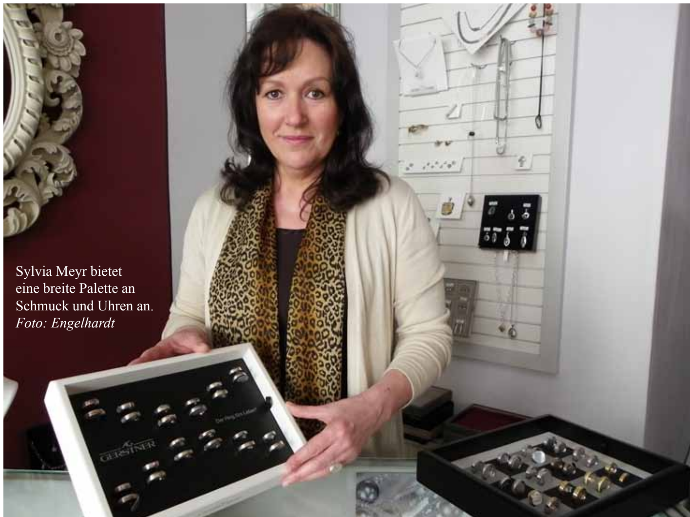
Sylvia Meyr bietet eine breite Palette an Schmuck und Uhren an.